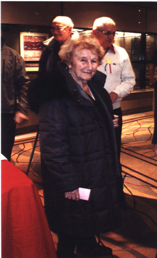
Madame Antonine Maillet, première récipiendaire du Méritas acadien en 1989.