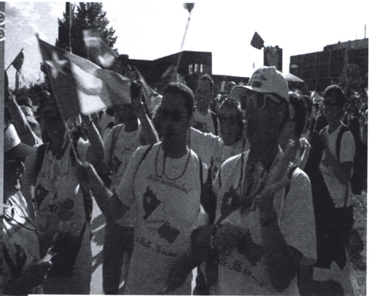
L'affiche du film. Les Acadiens de Belle-Île-en-Mer devant la Croix de la Déportation.